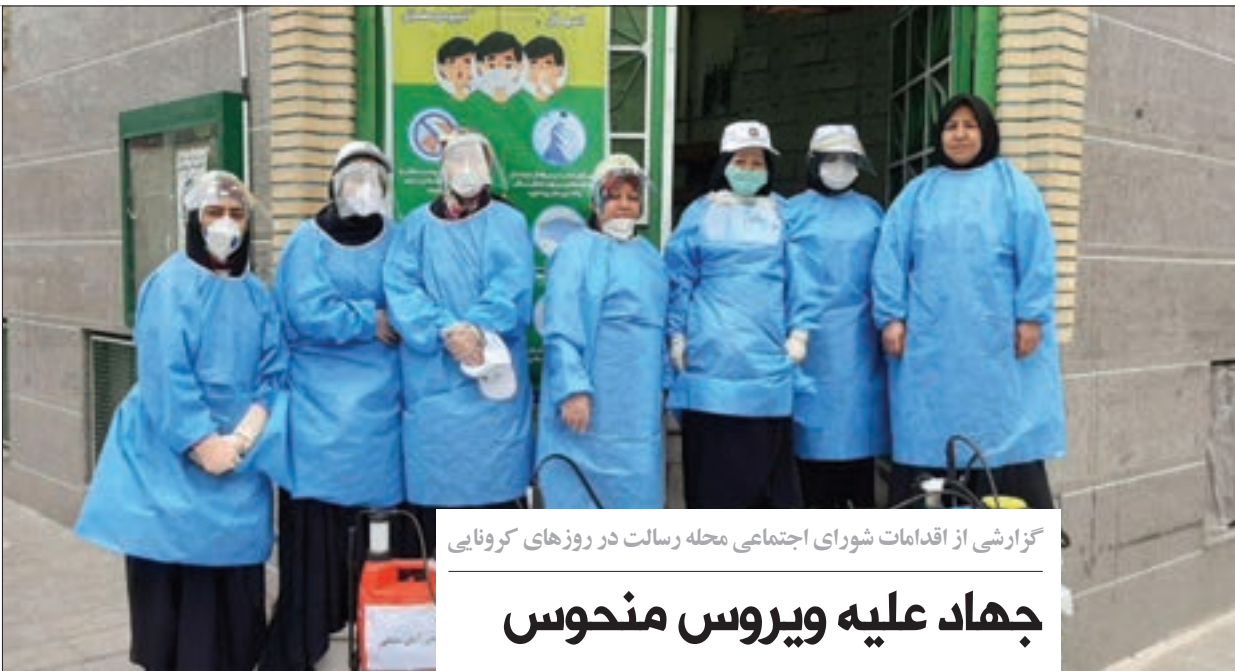
گزارشی از اقدامات شورای اجتماعی محله رسالت در روزهای کرونایی