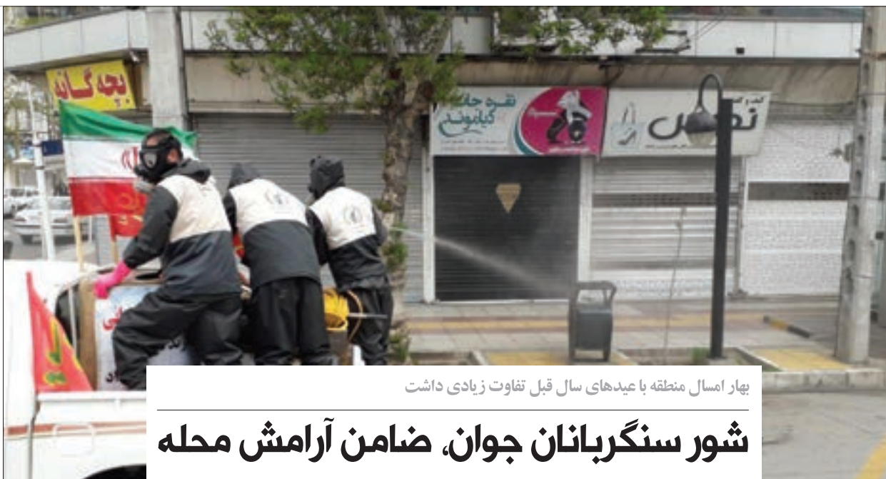
بهار امسال منطقه با عیدهای سال قبل تفاوت زیادی داشت