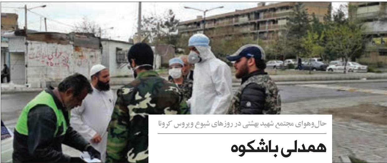
حال و هوای مجتمع شهید بهشتی در روزهای شیوع ویروس کرونا

شهرداری مشهد و مناطق و شهر و ندان این محله‌ها که تعدادشان هم کم نیست، در حرکت‌هایی خودجوش و فوری آستین همت‌بالا زدند و اقدامات خوبی را برای گذرندایی معابر عمومی حاشیه‌شهر انجام دادند و همچنان انجام می‌دهند. اما باید بپذیریم بهداشت داخلی و کمبود آب و بعضاً نبود آب سالم بهداشتی در نقاطی از حاشیه‌شهر مشهد درد کر و نارامی افزاید. گام بعدی، اقتصاد شکننده حاشیه‌نشین‌های مشهد است که کارشان یا خدمات هتل‌ها تعطیل شده است یا متأسفانه کارگرهای روزمزد هستند که باید دولت و نهادهای حاکمیتی نگاهی ویژه برای اختصاص بسته‌های معیشتی بیش از آنچه در نظر گرفته شده است برای این عزیزان داشته باشند و این کمک تارفع این شرایط و عبور از این بحران ادامه داشته باشد تا آن‌ها همچون گذشته بتوانند به زندگی عادی خود بازگردند یا تسهیلاتی بدون پیچ و خم‌های اداری و بدون سود به آن‌ها اعطا شود تا خود را بازیابی کنند. کمبود خانه‌های بهداشت و نبود آموزش‌های لازم به میزان کافی در حاشیه‌شهر و به ویژه و ستاهای مجاور مشهد می‌تواند گام دوم آید می‌کرونا را بسیار خطرناک‌تر از گام اول ظاهر سازد که نیازمند فعال‌تر شدن مراکز بهداشتی در مان برای امداد به مناطق کم‌برخوردار و تجهیز کردن این مراکز به امکانات و تجهیزات کافی است. در پایان باید گفت نرفتن به کمک حاشیه‌نشینان یعنی سرعت بخشیدن به کوتاه شدن عمر و تداوم و طولانی شدن شیوع ویروس کرونا، این قاتل ناآشنا در شهر و حاشیه‌شهرها. ان‌شاء... نگاهی ویژه‌تر به محلات کمتر توسعه یافته از سوی مدیران و نهادهای مدنی و سازمان‌های مردم‌نهاد ایجاد شود.