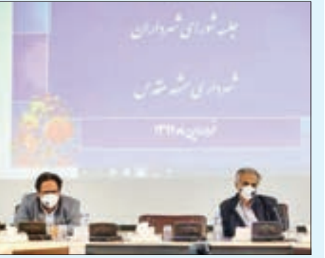
روزنامه شهرامید مشهد

در جلسه شورای شهرداران مناطق تأکید شد هماهنگی شهری در روزهای کرونایی