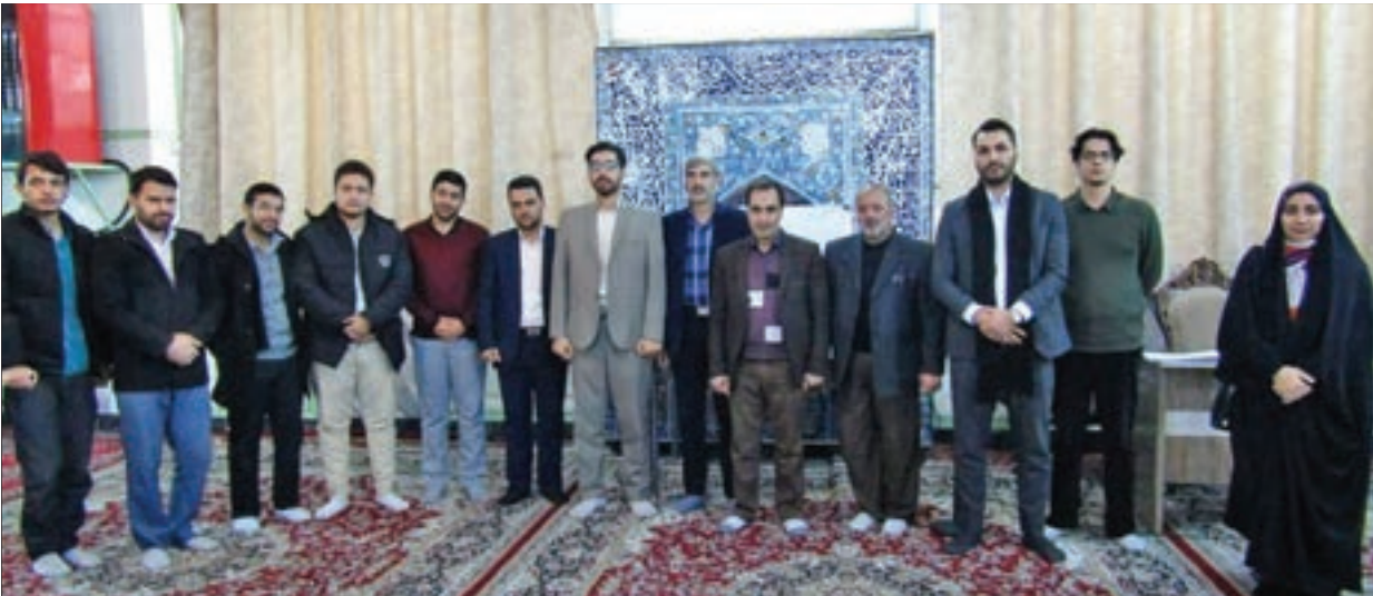
رئیس اداره اجتماعی و فرهنگی شهرداری منطقه عنوان کرد:

از آب گرفتگی معابر از سر گرفت. شست و شوی کانال ها و جوی ها یکی از این اقدامات بود. افزون بر این تمامی چاه های جاذب در منطقه تخلیه و نظافت شد. با ادامه بارندگی ها، روند پیشگیری از بارندگی با قوت ادامه خواهد یافت. ■