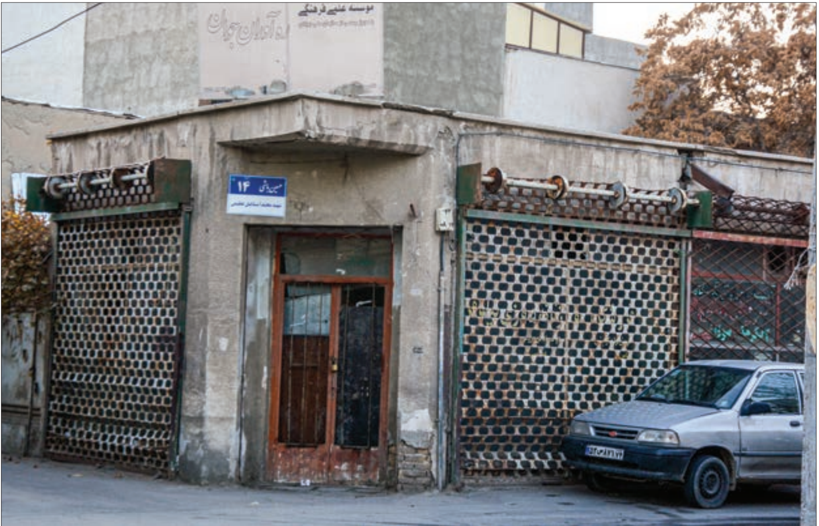
نگاهی به علت نام گذاری یک محله قدیمی در منطقه ما