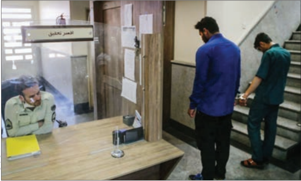
عکس ثبتی است

مأموران کلانتری سجاد که از قبل در متهمان را در پولوار فردوسی مشهد زده بودند و آن ها را تحت نظر داشتند، زمانی که ۲ مجرم موتورسواری قصد پاییدن گوشی تلفن همراه یکی از شهروندان را داشتند وارد عمل شدند و یکی از اعضای این تیم