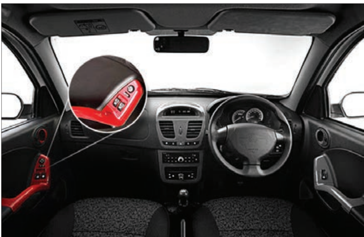
طرح: علی مصطفی بیکل / افروز

خودروهای مشکل دار سایپا در زیمباوه جنجال آفرین شدند