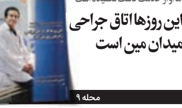
کرونا جان خواهر دکتر موسوی را گرفت اما او از خدمت دست نکشیده است