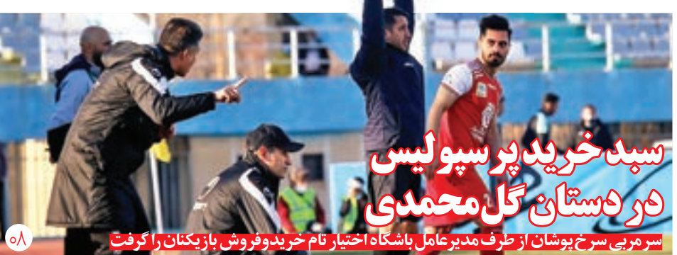
سر مربی سرخ پوشان از طرف مدیرعامل باشگاه اختیار نام خرید و فروش بازیکنان را گرفت