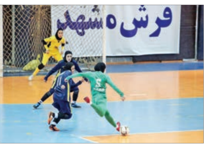
فرش ه شهید

مدارک نام نویسی اعضای تیم خود را ثبت کند، در بازی هفته اول غایب بود و نتیجه بازی آن ها ۳۰ به سود حریف یعنی تیم آبادان اعلام شد. شنیده می شد مسابقه پارس آرا با نفت آبادان به صورت معوقه برگزار شود، اما مسئول سازمان لیگ گفت فرصتی برای برگزاری مسابقات معوقه ندارند. در هفته دوم نیز پالایش نفت با قرعه استراحت روبرو بود و به میدان نرفت و به این ترتیب لیگ برای برزیلی ها از هفته سوم آغاز شد. در اولین بازی آن ها تیم تازه وارد کیمیای اسفراین را شش تایی کردند و اولین امتیاز خود در فصل جدید را به دست آوردند. بعد از دختران اسفراینی نوبت به دیگر تیم قعر نشین یعنی هیئت اصفهان رسید که پالایش نفت آبادان این تیم را با ۱۱ گل شکست داد. اما در هفته پنجم لیگ، پالایش نفت بعد از ۲ بازی آسان باید برابر قهرمان فصل گذشته یعنی مس فرسنجان به میدان می رفت. مسی ها که اولین شکست خود