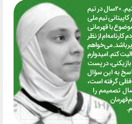
تیم ملی در رده های پایه نداشتیم. ۲۰ سال در تیم ملی دست به توپ بودم و افتخار کاپیتانی تیم ملی را هم دارم که خوشبختانه این موضوع با قهرمانی در لیگ به پایان رسید. سعی کردم کارنامه ام را نظر مربیگری در بدن سازی و هندبال برپاشم. می خواهم بعد از این در بخش مربیگری فعالیت کنم. امیدوارم که بتوانم درخشان تر از ۲۰ سال بازیکنی، در پست مربیگری خدمت کنم. او در پاسخ به این سؤال که چه زمانی تصمیم به خداحافظی گرفته است، تصریح می کند: من اول امسال تصمیم را قطعی کرده بودم، حتی اگر تیم هم قهرمان نمی شد، باز خداحافظی می کردم.

رقابت های قهرمانی کشور وزنه برداری جانبازان و معلولین بانوان در تهران برگزار می شود. دومین دوره رقابت های قهرمانی کشور وزنه برداری بانوان، دابود پهلوان سیامند رحمان در ۲ رده سنی جوانان و بزرگسالان روز شنبه ۹ اسفند در محل فدراسیون برگزار خواهد شد. همه تیم ها باید تست PCR را ۴۸ ساعت قبل از ورود به مسابقات انجام داده باشند و همراه داشتن دوربین، موبایل و تمامی لوازم الکترونیکی در سالن و محوطه برگزار مسابقات ممنوع است.