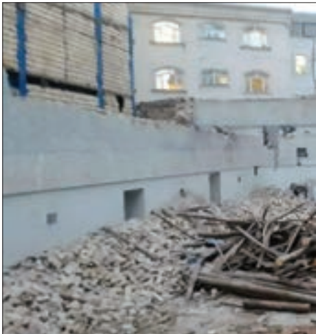
نگارخانه سینمای سینما

که با برنامه‌سی‌وی‌پنج داشت این ترجمه را ادای دین خودش به چند سال زندگی در آمریکا دانست و توصیه کرد دانشجویان رشته تاریخ آن را مطالعه کنند. قاضیانی با اشاره به اینکه این کتاب را یک سفید پوست نوشته که سال‌ها درباره سرخپوست‌ها تحقیق کرده‌است گفت: «در روزهای پایانی که در آمریکا بودم شماره نویسنده این کتاب را پیدا کردم و با او تماس گرفتم. خانمی تلفن را برداشت و به من گفت نمی‌توانم با آقای واشبرن صحبت کنم. آن لحظه جا خوردم و فقط توضیح دادم که من یک دختر ایرانی‌ام و می‌خواهم کتاب ایشان را به کشورم ببرم و ترجمه کنم. زمانی که آن خانم توضیحات من را شنید گفت شما نمی‌توانید با واشبرن صحبت کنید چون ۲۲ روز پیش فوت کرده‌است و به این صورت فرصتی پیش نیامد که من با نویسنده کتاب صحبت کنم.» این هنرمند همچنین در گفت و گو خود تأکید کرد که دیگر ترجمه را ادامه نمی‌دهد و می‌خواهد خودش بنویسد. «روبای نوشته‌م مثل بازیگری و موسیقی همیشه با من بوده و جزو فانتزی‌های من است و دوست دارم روزی کتاب بنویسم.»