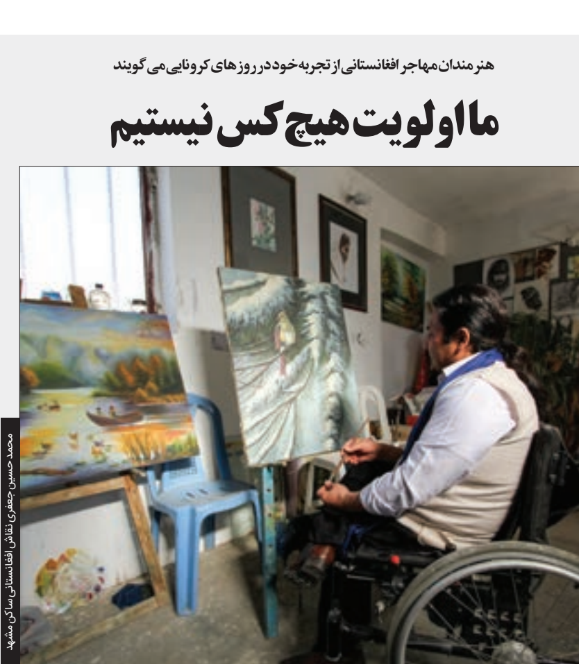
محمد رضا هاشمی

که با کلاه قرمزی انجام می‌داد، نبود. بعد از برنامه تلویزیونی «صندوق پست» که لویدست‌آزر کلاه قرمزی برداشت و نه کلاه قرمزی آقای مجری را رها کرد. این همکاری ادامه پیدا کرد و او چندین برنامه تلویزیونی و چندین فیلم سینمایی که نقش اولش کلاه قرمزی بود ساخت. از ابتدای دهه ۸۰ تا الان آقای مجری و کلاه قرمزی حضور پا به قرصی در سینما و تلویزیون داشته‌اند. باینکه شخصیت‌های دیگری چون «فامیل دور»، «آقای همساده» و ... در دهه ۹۰ در کنار کلاه قرمزی به دنیای آقای مجری پا گذاشتند ولی هیچ کدام نتوانستند جای «کلاه قرمزی» را بگیرند.