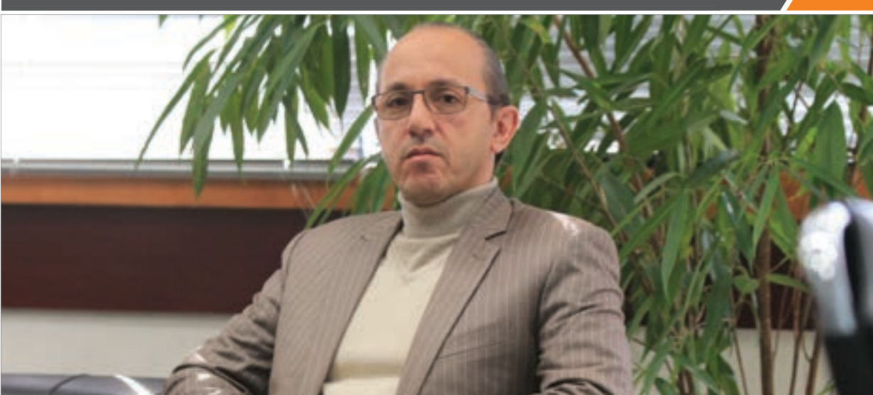
رئیس کمیسیون حقوقی شورای اسلامی شهر مشهد در بازدید از بوستان‌های منطقه

مقدم گفت: کاشت حدود ۱۳ هزار اصله درخت با هدف گسترش فضای سبز و بهینه‌سازی تنفس شهری، در اماکن و عرصه‌های مختلف بوستان خورشید انجام شد که این امر در آینده‌ای نزدیک نقش مهمی در گسترش فضای سبز و پاکیزگی هوای شهر مقدس مشهد، ایفا خواهد کرد.