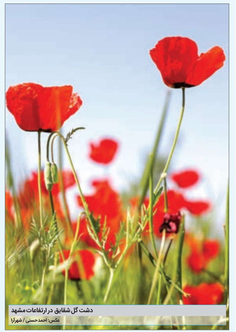
دشت گل شقایق در ارتفاعات مشهد