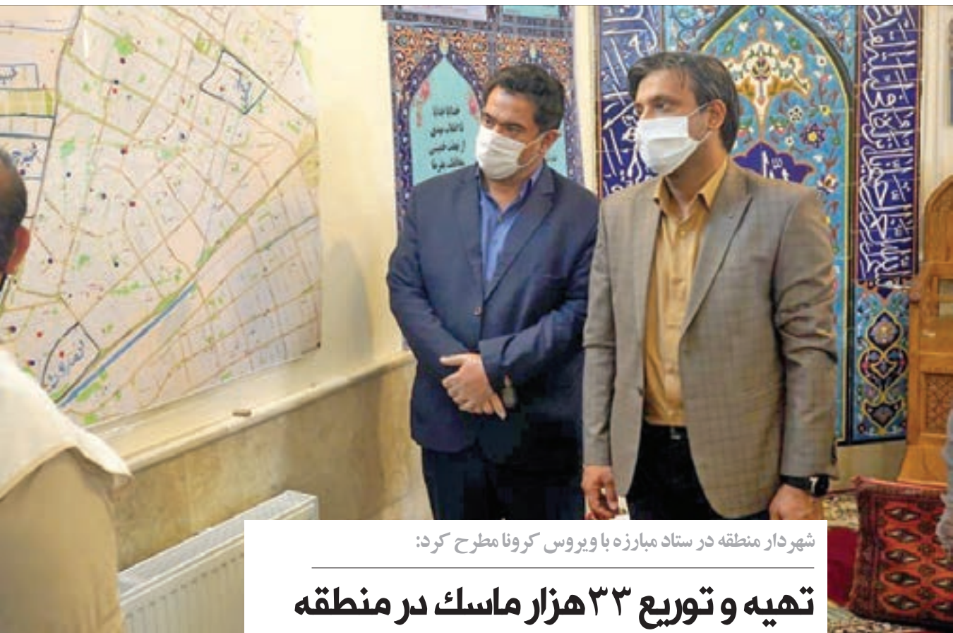
شهردار منطقه در ستاد مبارزه با ویروس کرونا مطرح کرد:

اهمیت تشکیل این هیئت مدیره به این دلیل است که در گذشته تشکل ها دارای افراد مشترکی بودند و بعضاً به خانواده هایی دو یا سه بار کمک می شد، در حالی که برخی خانواده های حتی نیازمندتر که تاکنون شناسایی نشده اند، از دریافت کمک خیران محروم هستند. امید است با همکاری اهالی و تشکل های فعال محله توانسته باشیم به هدفمان که همانا کمک به فقرا، نیازمندان و همه اشخاصی که به واسطه شیوع و اپیدمی ویروس کرونا، کار و بار خود را از دست داده و در تنگنای مالی قرار گرفته اند، جامعه عمل بپوشانیم. ■