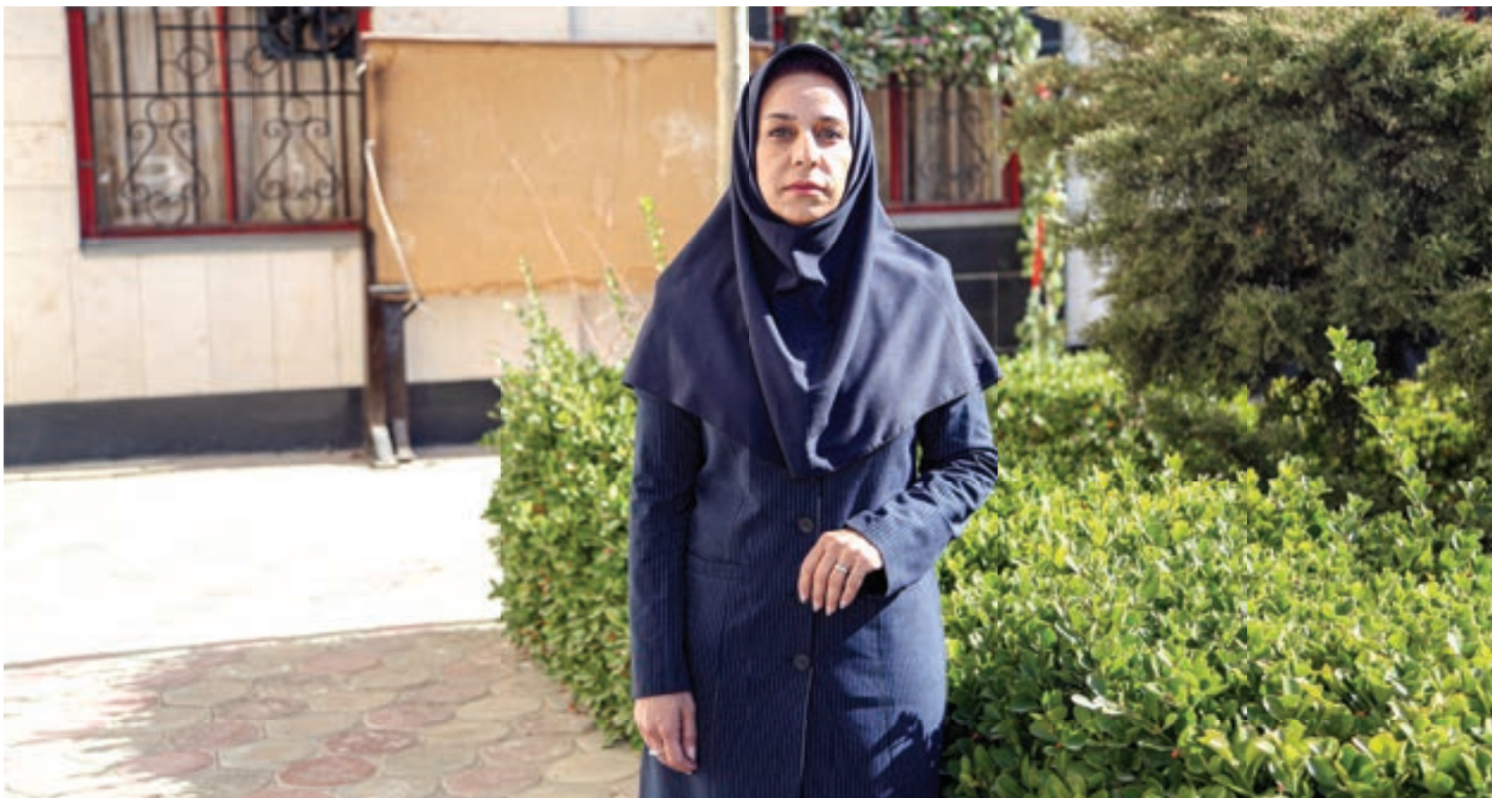
معلم ساکن الهیه از فعالیت خود در مدارس مناطق حاشیه شهر می گوید