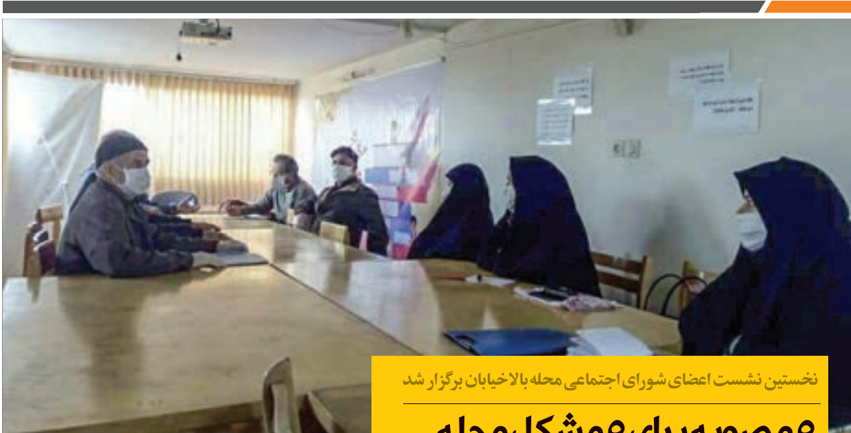
نخستین نشست اعضای شورای اجتماعی محله بالاخیابان برگزار شد