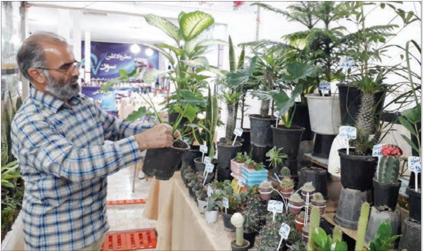
گفت‌وگو با گل فروش خیابان هنرور