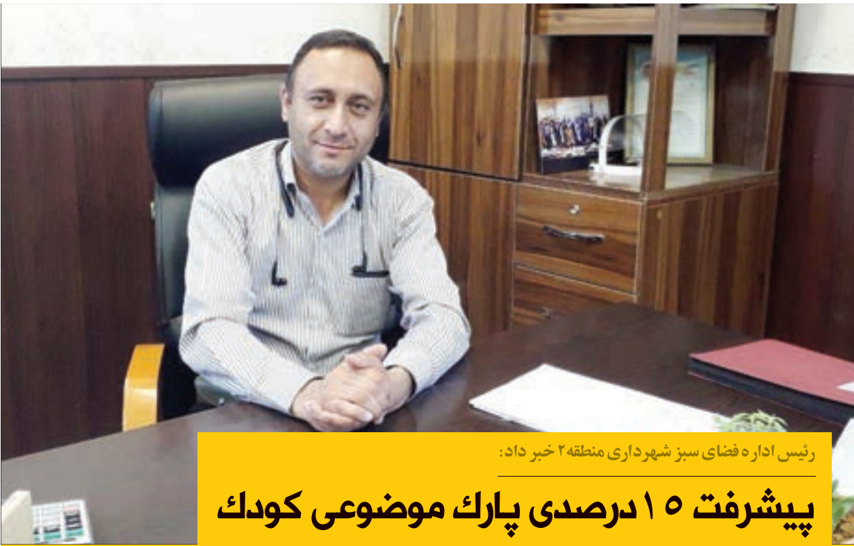
رئیس اداره فضای سبز شهرداری منطقه ۲ خبر داد:

شهردار منطقه ۲ مشهد گفت: اقدامات و فعالیت‌های مناطق سیزده‌گانه در حوزه خدمات شهری به‌صورت سه‌ماهه ارزیابی و رتبه‌بندی می‌شود. در ارزیابی سه‌ماهه چهارم سال گذشته رتبه خوبی کسب کردیم. جلال قربانی افزود: طبق این ارزیابی، شهرداری منطقه ۲ در حوزه محیط‌زیست