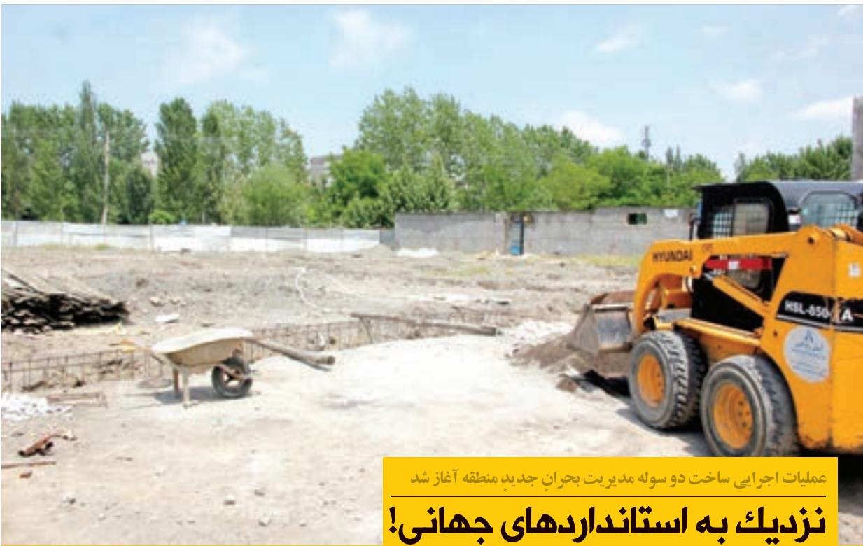
عملیات اجرایی ساخت دو سوله مدیریت بحران جدید منطقه آغاز شد