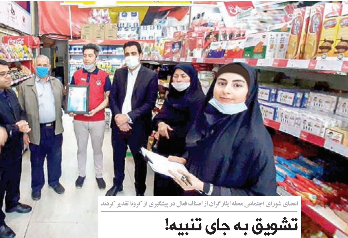
اعضای شورای اجتماعی محله ایثارگران از اصناف فعال در پیشگیری از کرونا تقدیر کردند