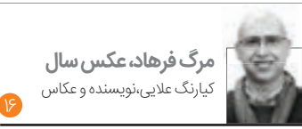
مرگ فرهاد، عکس سال کبارک علایی، نویسنده و عکاس