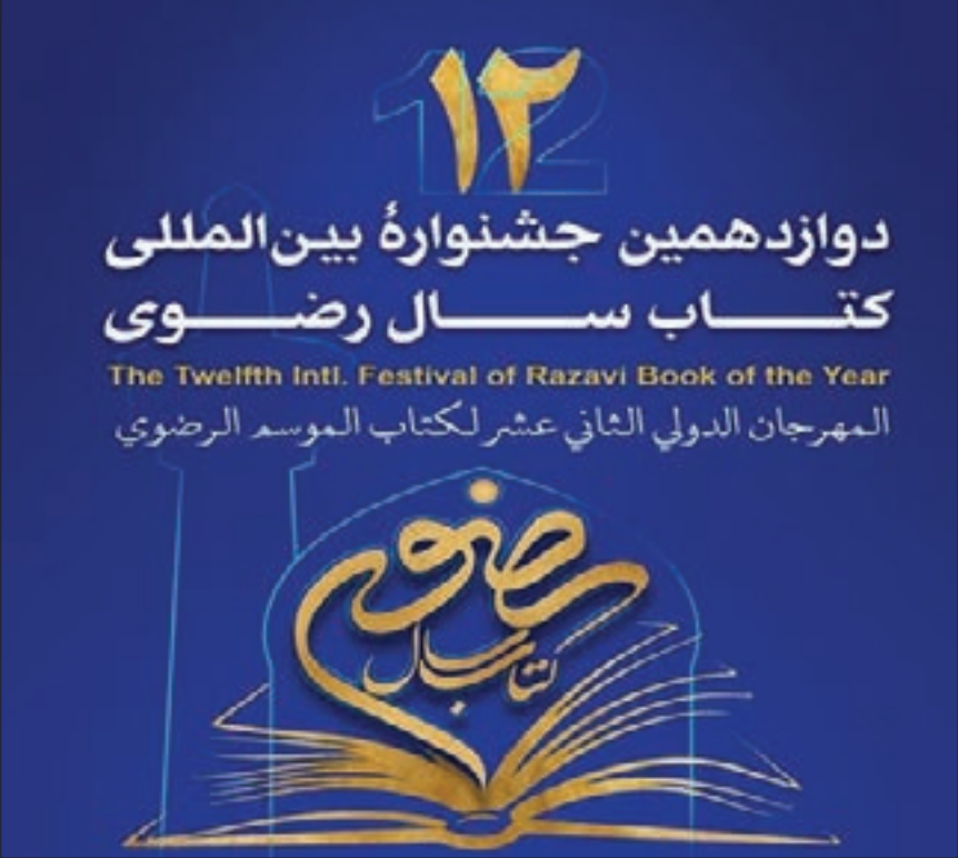
شکیبا افخمی راد