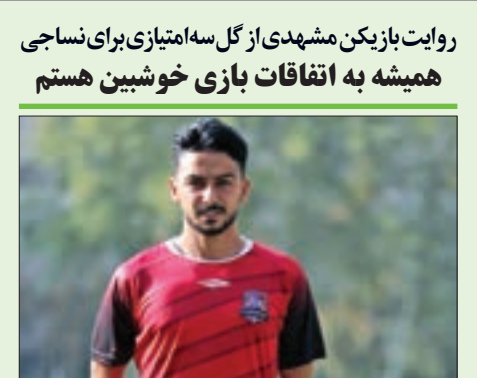
روزنامه شهریار دید ورزشگاهی

روایت بازیکن مشهدی از گل سه امتیازی برای نساجی همیشه به اتفاقات بازی خوشبین هستم