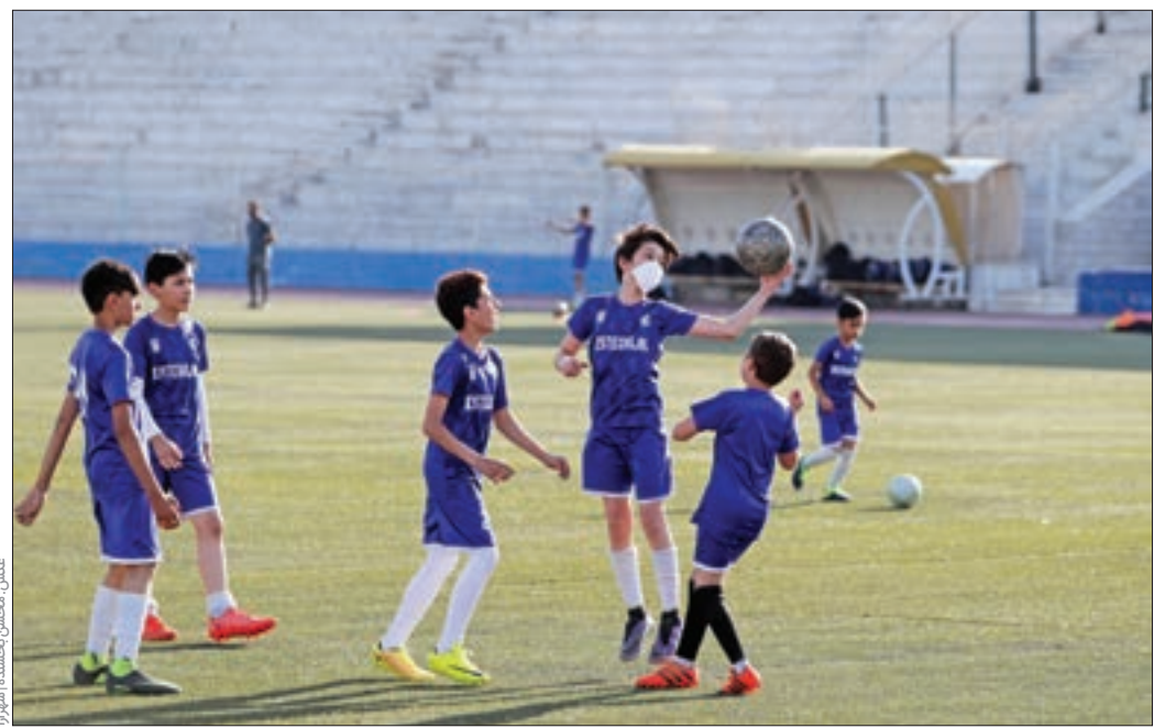
تست رعایت پروتکل ها

نسبت به تهیه شیوه نامه برگزاری مسابقات مطابق با پروتکل های بهداشتی اقدام کردند تا خطرات ناشی از برگزاری دوباره رقابت ها در شرایط ویژه کروناپی شهر مشهد را به حداقل برسانند.