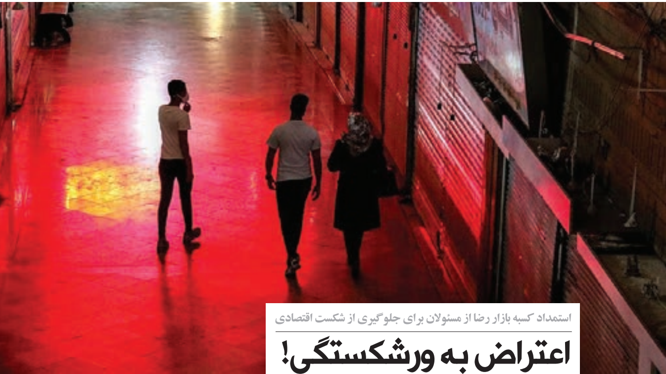
استمداد کسبه بازار رضا از مسئولان برای جلوگیری از شکست اقتصادی