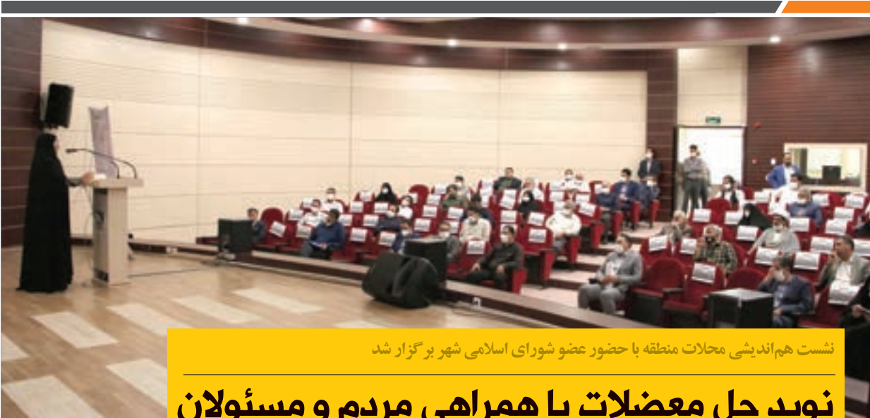
نشست هم اندیشی محلات منطقه با حضور عضو شورای اسلامی شهر برگزار شد