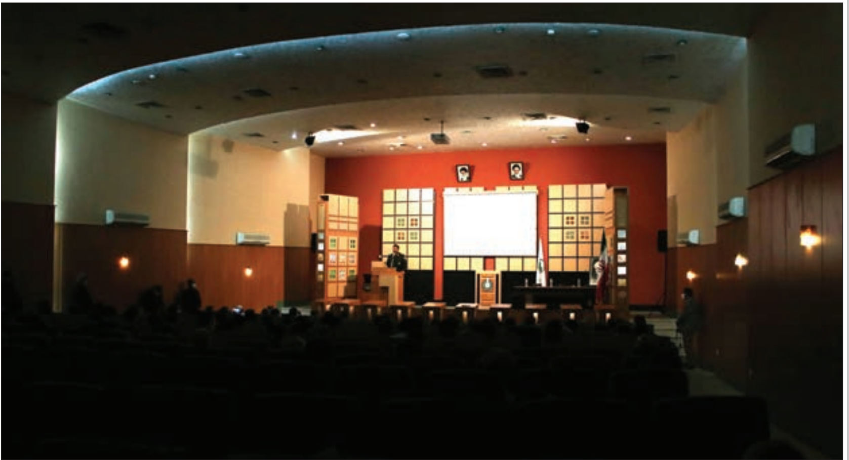
ستاد مقابله با کروناى شهرک طرق از فعالان این عرصه تقدیر کرد