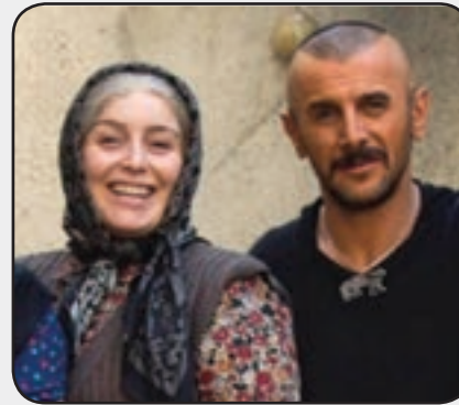
ژاله صامتی در «درخونگه»