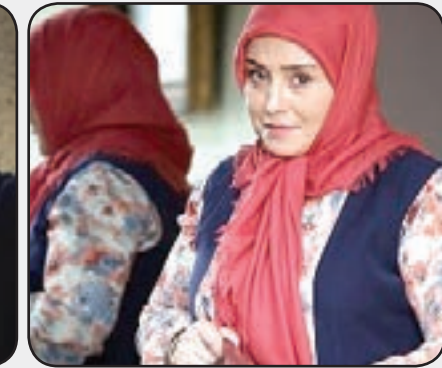
ژاله صامتی در «زیرخاکی»