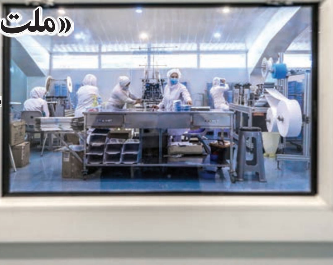
عکس از تولیدی است