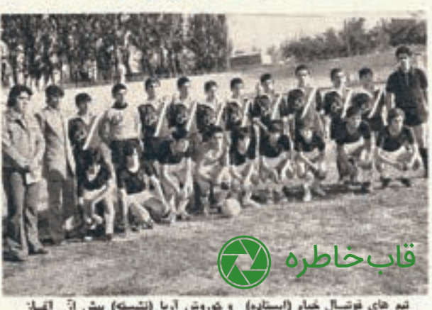
تیم های فوتبال خیام (ایستاده) و کوروش آریا (نشسته) بیش از اعزاز مسابقه نهایی نوجوانان مشهد