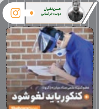
حسین غنقیان، سریع‌ترین مرد ایران، در جدیدترین استوری اینستاگرامش از فوکنکور حمایت کرده است. غنقیان با انتشار خبر «کنکور باید لغو شود» شهرآرانیوز به حمایت‌از این مسئله پرداخته و از مسئولان خواسته است تا کنکور را به‌خاطر وضعیت خطرناک‌کروناایی لغو کنند.