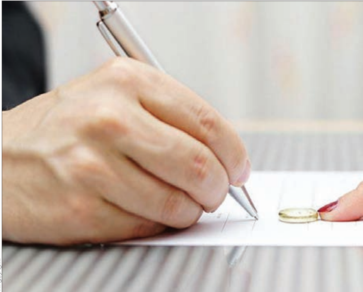
عکس: ژانینی است