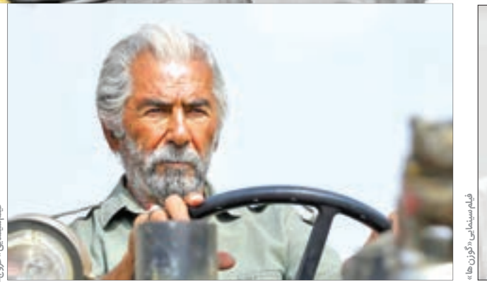
فیلم سینمایی «خروج»

هوشمندانه و در دهه شصت و هفتاد شجاعانه بوده‌است. همکاری با بزرگان قریبان که سوپرستار فیلم‌های سینمایی دهه شصت و هفتاد بود با وجود درخشش در آثاری همچون «گوزن‌ها» به کارگردانی کیمیایی، «سایه‌های بلند باد» ساخته بهمن فرمان‌آرا، «سناتور» به نویسندگی فریدون جیرانی و کارگردانی مهدی صباغ‌زاده، دو سینماگر مشهور و «کانی‌مانگا» ساخته مرحوم سیفا... داد نتوانست خود را به سیمرغ برساند. اما در سال ۱۳۸۱ برای ایفای نقش در فیلم سینمایی «آل‌ایمر» توانست دیپلم افتخار جشنواره فجر همان سال را به دست آورد. همکاری‌های او با اصغر فرهادی، سینماگر مطرح، نه در جشنواره‌های داخلی که در جشنواره‌های خارجی نیز آورده‌هایی برای او داشته است که از آن نمونه می‌توان به جایزه بهترین بازیگر نقش مکمل مرد از جشنواره فیلم آسیا پاسیفیک و جایزه گرگ نقره‌ای از جشنواره بین‌المللی فیلم مسکو ۲۰۰۳ برای بازی کم نظیرش در فیلم «رقص در غبار» اشاره کرد. قریبان پس از آن در دومین همکاری با فرهادی در «شهر زیبا» جایزه ویژه هیئت داوران جشنواره بین‌المللی فیلم هند ۲۰۰۴ را نیز از آن خود کرد. فرود پس از «خروج» فرامرز قریبان در اعتراض به نادوری‌ها در جشنواره فیلم فجر برای همیشه از صحنه بازیگری خداحافظی و این تصمیم را در نشست خبری فیلم سینمایی «خروج» در جشنواره فیلم فجر پار سال رسانه‌ای کرد.