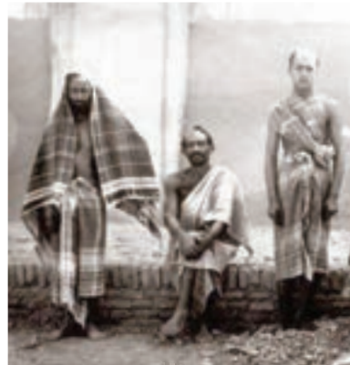
یادی از گرمابه‌های قدیمی و پیشه گرمابه‌داری در مشهد یک قرن پیش