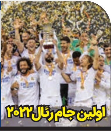
اولین جام رئال ۲۰۲۲

توضیحات علیرضا دبیر درباره سفر تیم ملی به آمریکا و حواشی به وجود آمده همه چیز از عکس حاج قاسم شروع شد