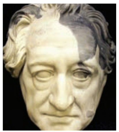
ولیاام شکسپیر، شاعر و نمایشنامه‌نویس انگلیسی (۱۵۶۴-۱۶۱۶).