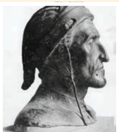
جیمز جوس، نویسنده ایرلندی (۱۸۱۲-۱۸۶۱).