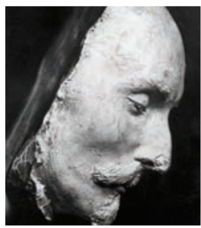
گئورگ ویلهلم فردریش هگل، فیلسوف آلمانی (۱۷۷۳-۱۸۳۱).