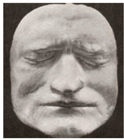
دانته آلیگیری، شاعر و نویسنده ایتالیایی (۱۲۶۵-۱۳۲۱).