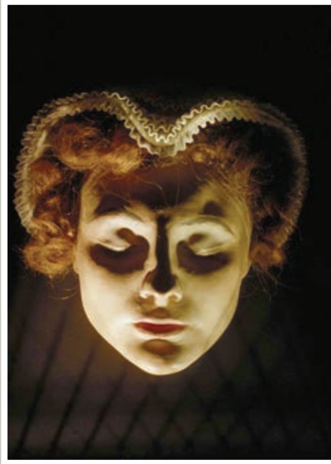
ویلیام شکسپیر، شاعر و نمایشنامه‌نویس انگلیسی (۱۵۶۴-۱۶۱۶).