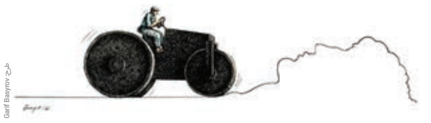
امیر منصور رحیمیان