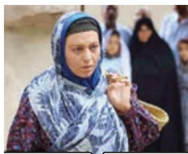
گیتی قاسمی، هنرپیشه‌ای که قانون میان سالی را شکست

روزنامه شهر امید و زندگی SHAHRARNEWS.IR ۳۰ ۰۳ ۱۴۰۰ ۲۴ صفحه ۱۲ صفحه ۴ صفحه روزی ۸ صفحه روزانه | شماره ۳۳۱۳ | ۱۰۰۰ تومان