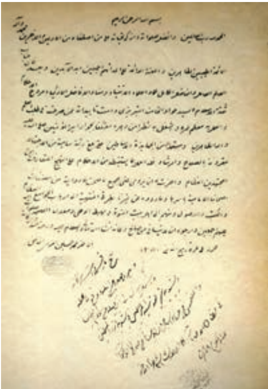
اجازه‌های درخشان... نائینی و آیتا... عبدالکریم حائری حائری آیتا... سید جواد خامنه‌ای