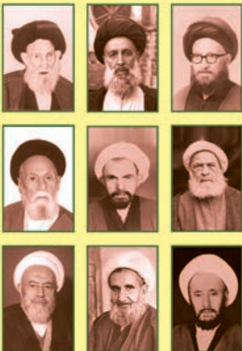
عناصیر حلقه فقهی «کمپانی» از راست به چپ: آیت‌الله العظمی سید علی علم الهدی، آیت‌الله العظمی سید جواد خامنه‌ای، آیت‌الله العظمی سید محمد رضا کلباسی، آیت‌الله العظمی سید جلیل الدین حسینی، شیخ اسماعیل کاتب، میرزا باقر تبریزی، شیخ محمد رضا بخارایی.

میرزا محمد رضا کلباسی، آقا سید علی رضوی، آقای درچه‌ای از اعضای غیر ثابت این محفل علمی بودند. گاهی برخی از علمایی که از شهرستان به مشهد می‌آمدند در این جلسات حضور پیدا می‌کردند. این جلسه یک ساعت مانده به اذان ظهر تشکیل می‌شد و افراد شرکت کننده در این جلسه با نشاط خاصی به طرح مباحث فقهی و اصولی می‌پرداختند. سبک جلسه به این صورت بود که فردی متن خاصی را برای همه می‌خواند و بقیه افراد در باره این متن به بحث و گفت‌وگو می‌پرداختند. محوریت مباحث مطرح شده نیز بر اساس کتاب‌هایی نظیر جواهر الکلام، حقائق الناظره، مدارک الاحکام، شرایع الاسلام و مستند الشیعه بود. اگر وقتی باقی می‌ماند حضار به بررسی تحولات و اتفاقات روز نیز اشاره می‌کردند. این جلسه علمی تا زمان حیات همه شرکت کنندگان آن ادامه داشت.