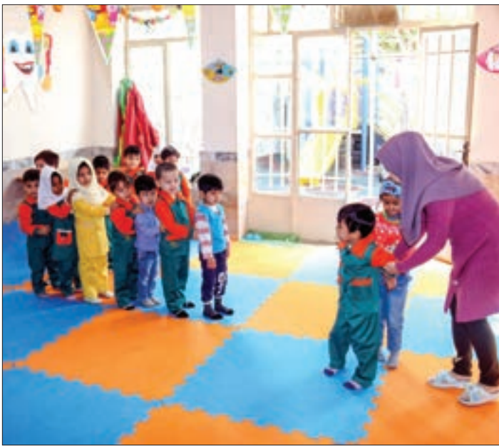
عکس: های مجاز از شهروندان