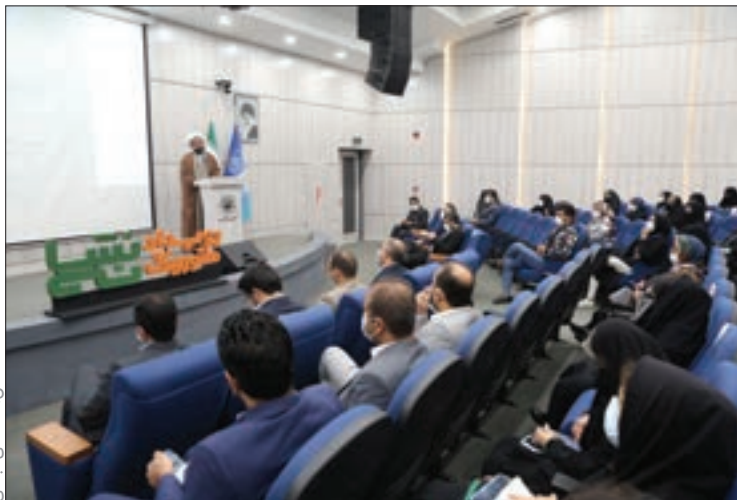
تکمیل و معضلاتی باطنی

امیررضا وثوقی a.vosoughi@shahraranews.ir