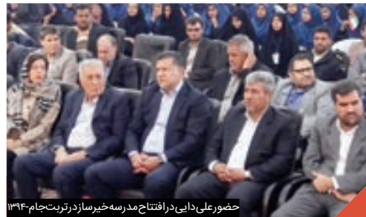
حضور علی دایی در افتتاح مدرسه خیرساز در تربت جام ۱۳۹۴