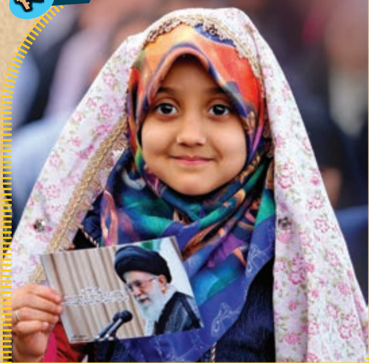
همشهری قدیمی؛ مهمان دوست داشتنی