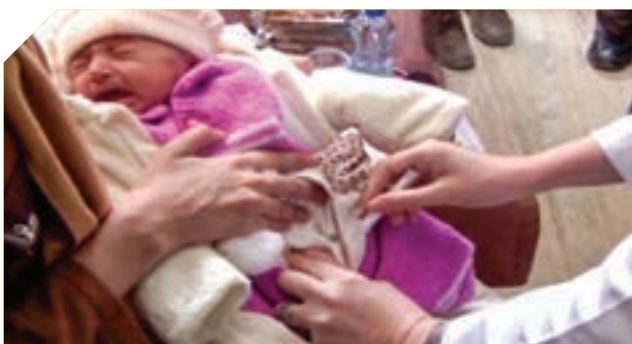
عکس تزئینی است