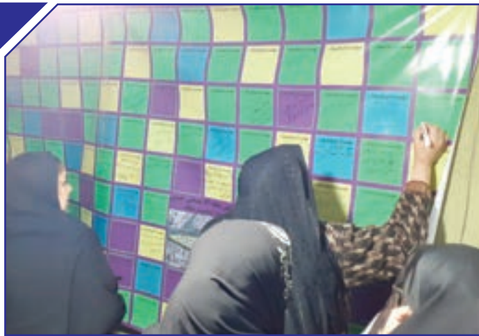
اجرای طرح محله مادر منطقه با کمک اعضای شورای اجتماعی محلات

نیکو عقیده | سال ۱۳۹۱ بود که اولین شوراهای اجتماعی محلات زیر نظر معاونت فرهنگی و اجتماعی شهرداری مشهد در این شهر شکل گرفت. گروه های مردمی ای که قرار بود مشارکت محله ای شهروندان را جلب کنند تا برخی فعالیت های اجرایی شهرداری به خود مردم واگذار شود. حالا چند دوره گذشته است و چیزی به انتخابات دوره جدید شوراهای اجتماعی محلات باقی نمانده است. به سراغ اعضای شورای اجتماعی محله های منطقه ۶ می رویم تا تحلیلشان را از دوره های قبل بدانیم و از انتظارات و توقعاتشان بنویسیم.