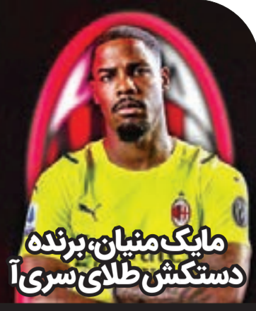
مایک منیان، برنده دستکش طلای سری آ

جمع بندی آماری عملکرد مهاجم ایرانی پورتو در فصل ۲۰۲۰-۲۱ لیگ پرتغال نمره ۲۰ پای کارنامه طارمی