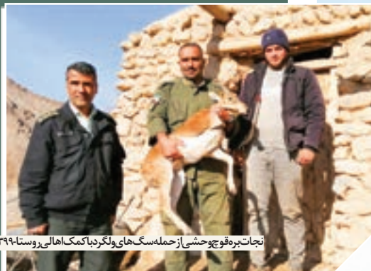
نجات بره قوچ وحشی از حمله سگ های ولگرد با کمک اهالی روستا- ۱۳۹۸