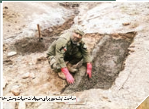
ساخت آبشخور برای حیوانات حیات وحش- ۱۳۹۸