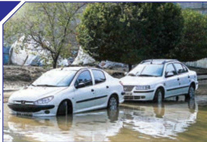
تصویر نیش الهیه ۱۶ اسفند