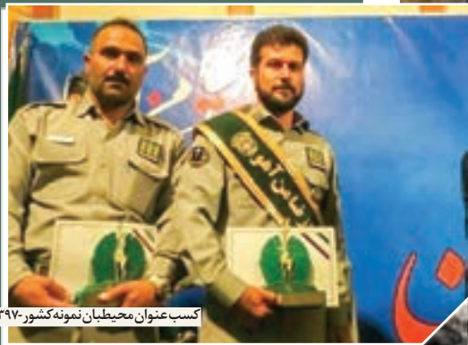
کسب عنوان محیطبان نمونه کشور- ۱۳۹۷