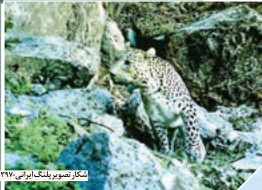
شکار تصویر پلنگ ایرانی- ۱۳۹۷