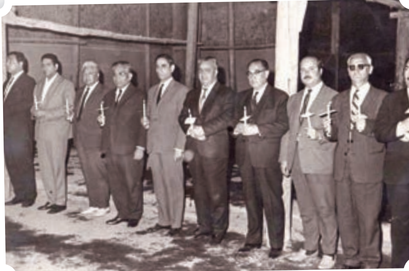
مراسم شمع گردانی در حرم مطهر رضوی در دوره پهلوی اول

در مجموع روشن کردن شمع در گذشته با برآورده شدن نذر و حاجت گره خورده بود و البته آداب و رسوم خودش را هم داشت؛ کاری که هنوز هم بین شهروندان مشهدی رواج دارد. البته بدون آداب و رسوم خاصی. کوچه پنجه یکی از همان جاهایی است که رسم شمع روشن کردن راتا کنون با خود آورده است. می گویند از قدیم همان طور که مردم به قدمگاه نیشابور می رفتند، برای دیدن اثر پنجه حضرت هم به این کوچه می آمدند؛ کوچه ای در پانصد متری حرم مطهر که همه شهرتش را از سنگ سیاهی روی دیوار دارد که منتسب به امام رضا (ع) است. این سنگ پس از چند بار جابه جایی به دلیل فراوانی ساخت و ساز و تخریب در بافت اطراف حرم، این روزها در گوشه ای از کوچه ای دو بیست متری به نام پنجه قرار دارد.