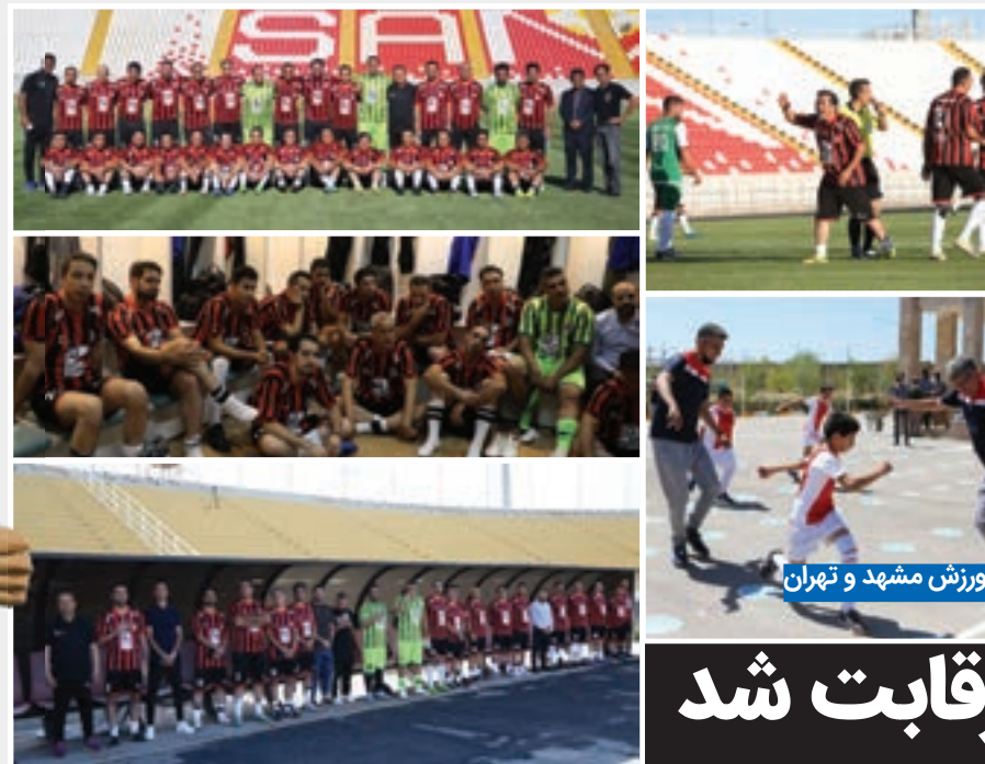
ورزش مشهد و تهران