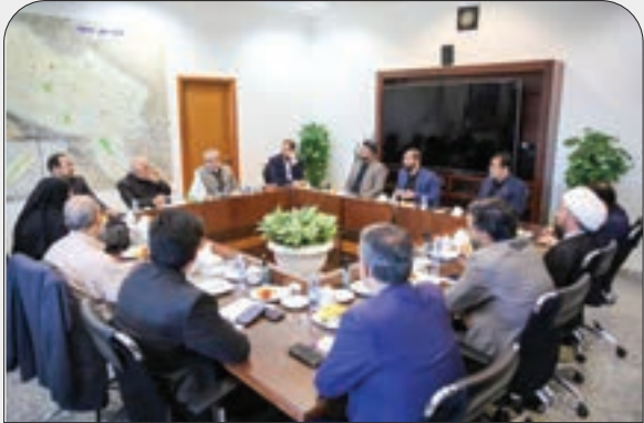
اعضای شورای اسلامی شهر مشهد با عباسعلی کدخدایی، عضو حقوق‌دان شورای نگهبان، دیدار کردند. اعضای پارلمان شهری مشهد در این دیدار به طرح دغدغه‌مندی‌های خود در زمینه محدودیت اختیارات شوراها پرداختند.

سرمایه‌گذاران در مشهد الرضا (ع) را تسهیل کند. زیرا در سید فرصت‌های سرمایه‌گذاری این شهر حلیف گسترده‌ای از ظرفیت‌ها گنجانده شده است. حسامی با بیان اینکه سرمایه‌گذاری نباید فقط به حوزه ساختمان محدود شود، گفت: شورای ششم سعی کرده است سطح نگاه اقتصادی را فراتر ببرد.