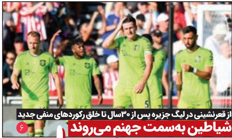
از قهرنشینی در لیگ جزیره پس از ۳۰ سال تا خلق رکوردهای منفی جدید شیاطین به سمت جهنم می‌روند