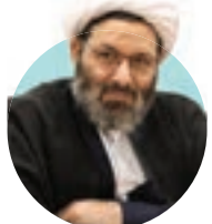
خانواده باید به این موضوع مهم برسد که در طول شبانه روز با فضای مجازی دور ماندن تا زمان مقتنی برای تقویت ارتباطات عاطفی، مانوس شدن اعضای خانواده با یکدیگر، ایجاد فضایی برای ایمن سازی فرزندان نسبت به حوادث بیرونی، تفریح خانوادگی ایجاد شود

روزی ایجاد شده چالش هایی در تربیت فرزندان و تشکیل یک خانواده ایمانی به وجود آمده است. به عنوان مثال اکنون مردم در سراسر دنیا در فضای جدیدی به نام «متاورس» به عنوان محیطی مجازی شبیه به زیست معمولی را تجربه می کنند، به طوری که در این فضای می توان بازی کرد و به کنسرت رفت یا حتی غذای مجازی سفارش داد. به هر حال نمی توان منکر این موضوع شد که فضای مجازی و شناخت نداشتن خانواده ها از فضای جدید و فاصله نسل ها به چالش هایی منجر می شود که می تواند برای فرزندان بین والدین یا فرزندان تفاوت هایی ایجاد کند. ● از کارشناس علمی و دینی کمک بگیرید