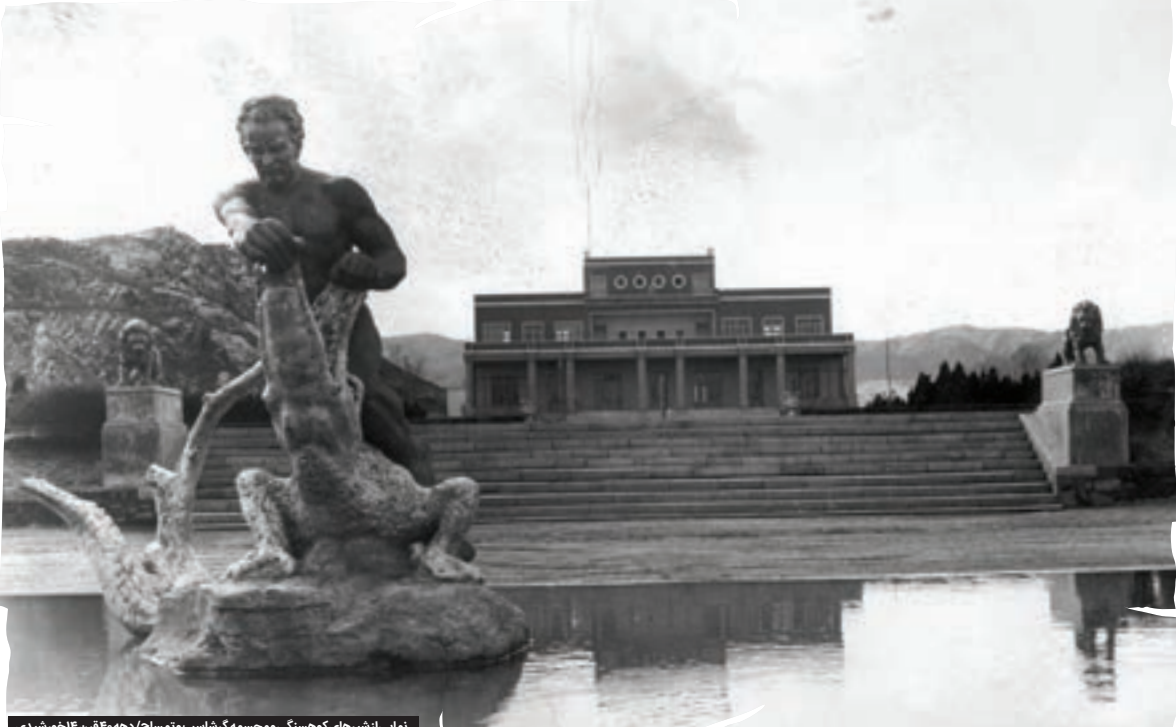
نمایی از شیرهای کوهسنگی و مجسمه گرشاسپ و تمساح؛ دهه ۴۰ قرن ۱۴ خورشیدی

او می‌گوید: اگر اشتباه نکنم، اولین آجرهای تالار پذیرایی کوهسنگی را در سال ۱۳۰۶ بنا کردند و در هزاره سوم فردوسی، هم‌زمان با دیگر بناهای مشهد مانند بیمارستان امام‌رضا ع و ساختمان هلال احمر، این مجموعه هم افتتاح شد. سالن پذیرایی را که از مقابل مانند یک کشتی در آب به نظر می‌رسد، در کنار استخر بزرگ ساختند و سال‌ها بعد در کنار استخر تعدادی مجسمه هم برپا شد. آن‌طور که عرب‌لین از حدود ۵۰سال قبل در خاطر دارد، عکاسان مشهدی، کوهسنگی را یک سال برای عکاسی از شهرداری اجاره می‌کردند. او تعریف می‌کند: در شهرداری برای اجاره کوهسنگی مزایده