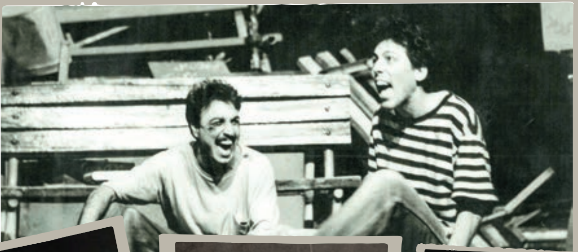
بازی رضا عطاران در تئاتر های تابستانه «چهارشنبه ها و پنجشنبه ها» در کارگردانی حسن حامد در مشهد