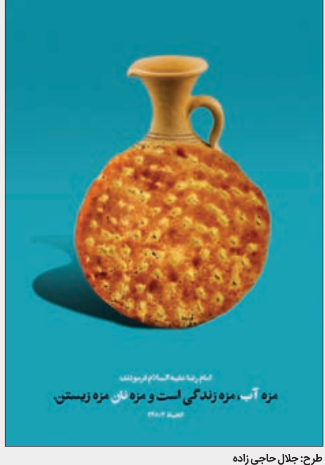
طرح: جلال حاجی زاده