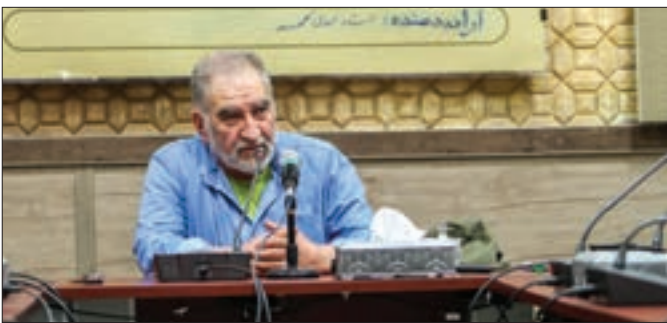
محسن محمدزاده، مدیرکل فرهنگ و ارشاد اسلامی

معاون سیما در ادامه سفر خود به مشهد با حضور در محل ضبط برنامه «دی‌بی‌سی» از عوامل آن تجلیل کرد. به گزارش صبا، محسن برمهانی در جمع عوامل «دی‌بی‌سی» گفت: این برنامه که پیش‌تر توجه افراد را در فضای مجازی به خود جلب کرده بود، به‌همت شبکه ۲ در برنامه پخش تلویزیونی هم قرار گرفت تا مخاطبان گسترده‌ای بیننده آن باشند. معاون سیما با اشاره به اینکه «دی‌بی‌سی» یک گام جدی در جهاد تبیین بود، اشاره کرد: در شرایطی که مادر اوج جنگ شناختی