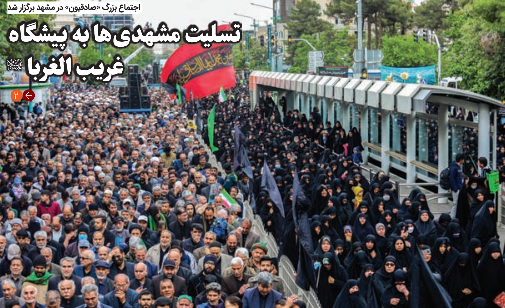
اجتماع بزرگ «صادقیون» در مشهد برگزار شد

فشارهای الاکلنگی درباره بیماری مزمنی که نیمی از مبتلایان به آن، از وجودش هم بی اطلاع هستند