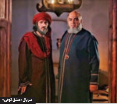
سریال «عشق کوفی»