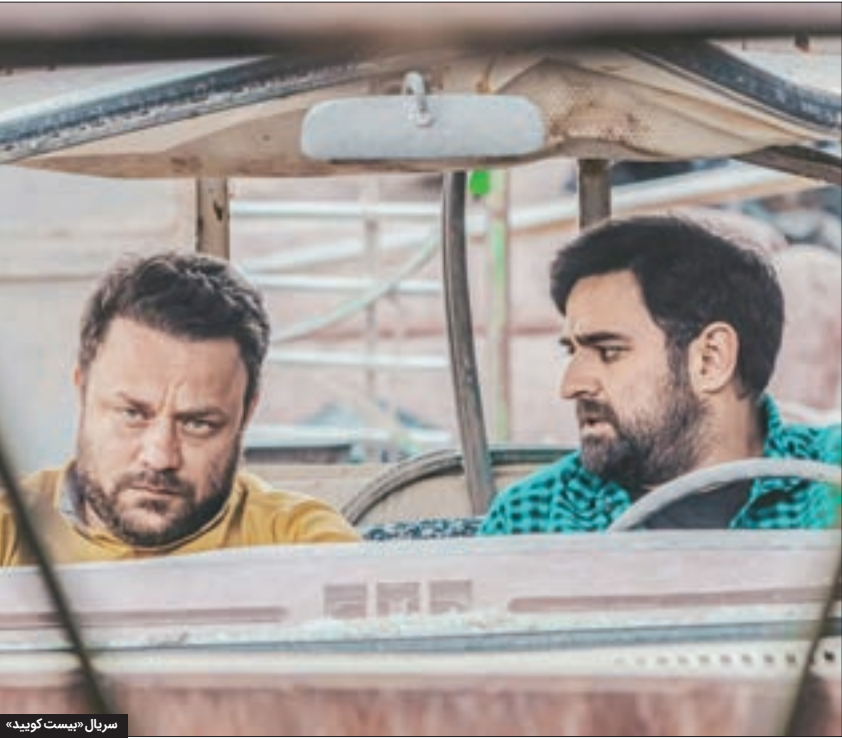
سریال «بیست کوبید»